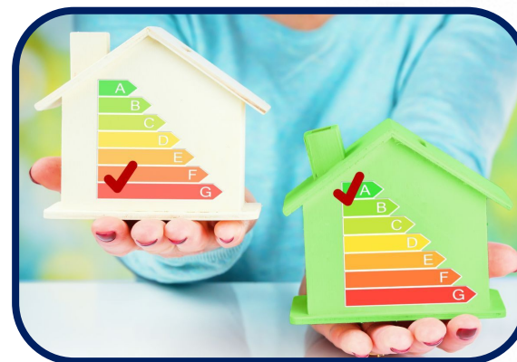
Edifici e elettrodomestici inefficienti