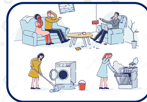
Specifiche esigenze energetiche domestiche