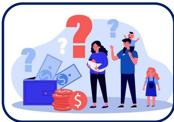
Bassi redditi familiari